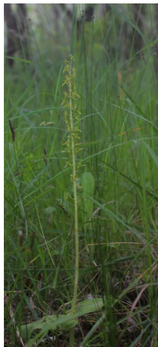
tojásdad békakonty ( Neottia ovata )