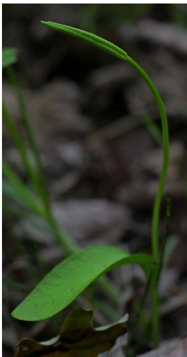
közönséges kígyónyelv ( Ophioglossum vulgatum )

Veszélyeztető tényezők feltárása. Védelmi stratégiák megfogalmazása.