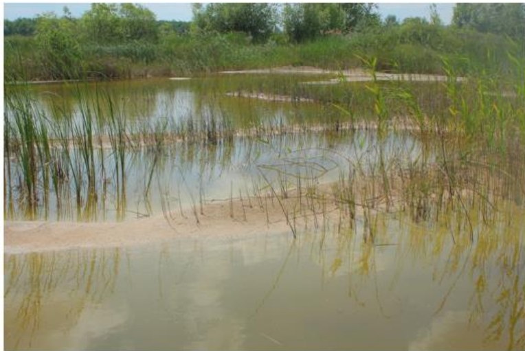
Wetland habitat in the post-mining site