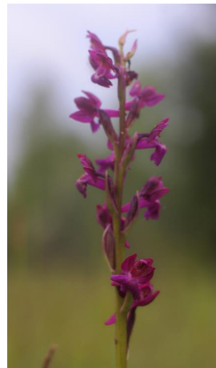
Orchis x timbalii