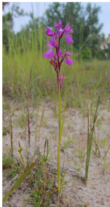
mocsári sisakkosbor ( Anacamptis palustris )